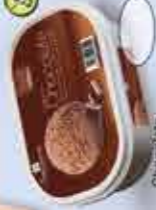
Chocolato 1000 ml