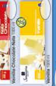
Vanilla-Chocolate-Nata 1000 ml