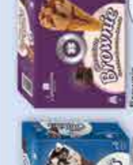
Brownie Chocolate 100 ml x 4