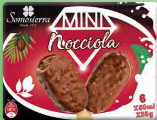
NOCCIOLA Chocolate con avellana Chocolate com avelã Chocolate with hazelnuts Chocolate avec noisette 6x50 ml / 6x38 g 500132