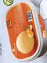
Sorbete Mandarina 1000 ml