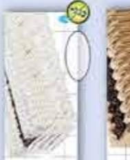
Nata 1200 ml