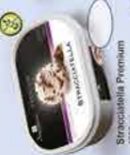
Stracciatella Premium 1000 ml