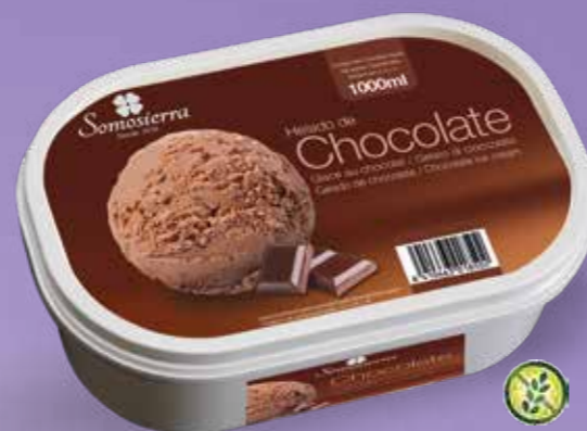
CHOCOLATE Chocolat 1000 ml / 470 g 200103