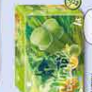
Jumpy Limón-Limon 140 ml x 6