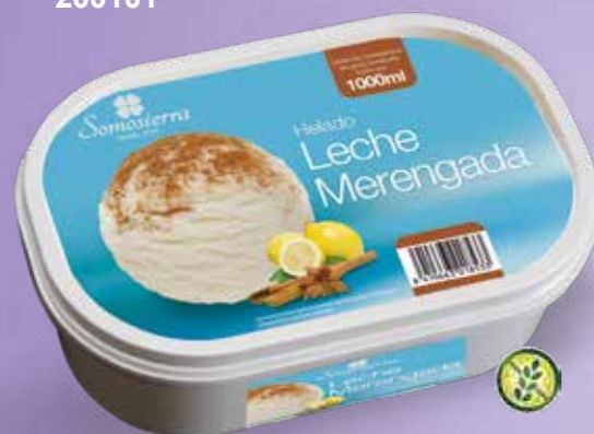
LECHE MERENGADA Leite de merengue Lait meringué Meringue milk 1000 ml / 470 g 200119