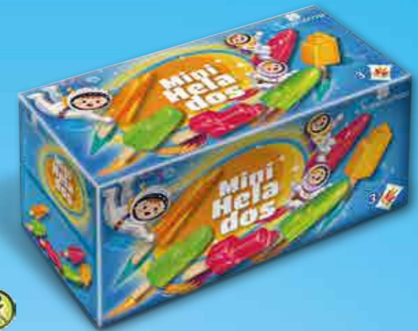
MINI HELADOS Fresa, Naranja, Manzana, Mandarina, Lima-limón 3x90 ml / 3x92 g 520112