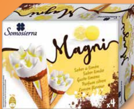
LIMÓN Limão Citron Lemon 4x120 ml / 4x65g 410120