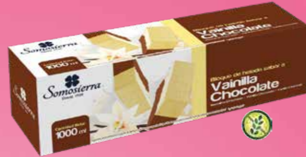
VAINILLA CHOCOLATE Baunilha Chocolate Vanille Chocolat Vanilla Chocolate 1000 ml / 450 g 110121