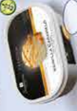
Vanilla Caramelo Premium 1000 ml