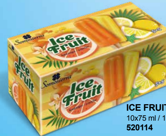
ICE FRUIT 5 Naranja + 5 Limón 10x75 ml / 10x77 g 520114