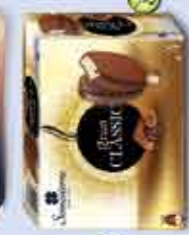
Gran Classic Vanilla 100 ml x 4