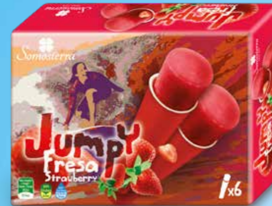
JUMPY FRESA 6X110 ml / 6X112 g 520116