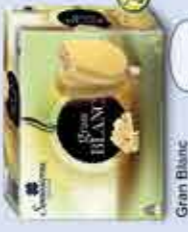
Gran Blanc Vanilla 110 ml x 4