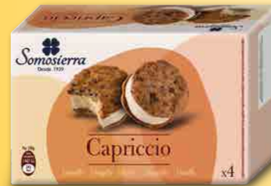
SANDWICH COOKIES CAPRICCIO Vainilla / Baunilha / Vanilla / Vanille 4x95 ml / 4x60 g 580101