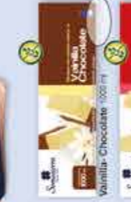
Vanilla-Chocolate 1000 ml