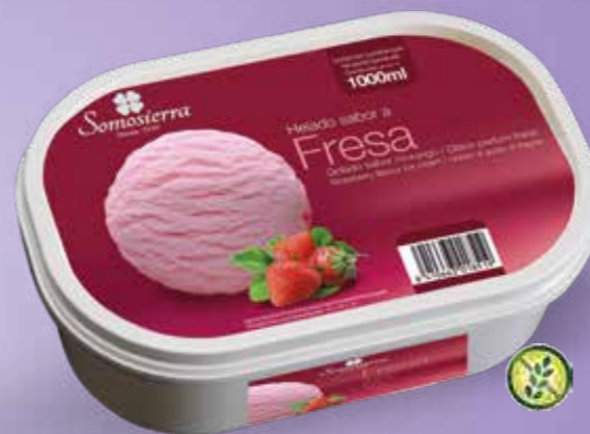
FRESA Morango Fraise Strawberry 1000 ml / 470 g 200102