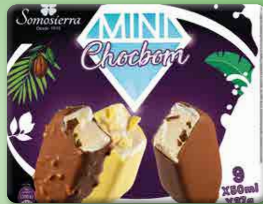
CHOCBOM 3 Blanco, 3 con leche, 3 con almendras 3 Branco, 3 com leite, 3 com Amêndoas 3 White, 3 milk chocolate, 3 with Almonds 3 Blanc, 3 chocolat au lait, 3 avec Amandes 9x50 ml / 9x37 g 500137