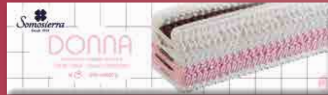
NATA-FRESA Nata Morango / Strawberry Cream / Crème Fraise 1200 ml / 600 g 340122