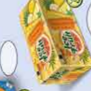
Mini Helados 50 ml x 3 (total de 6)