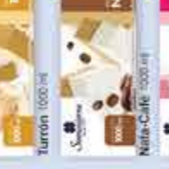
Turrón 1000 ml