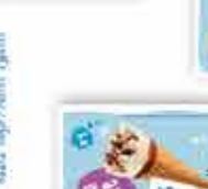
0% Azúcares añadidos Nata | Limón | Fresa