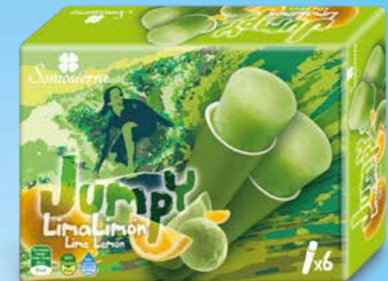
JUMPY LIMA-LIMÓN 6X110 ml / 6X112 g 520115