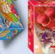
Jumpy Fresa 110 ml x 6