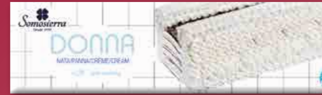
NATA Cream/ Crème 1200 ml / 600 g 340104