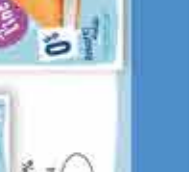
0% Azúcares añadidos Nata | Limón | Fresa