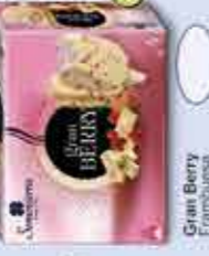
Gran Berry Frambuesa 110 ml x 4