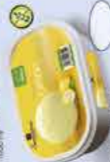
Sorbete Limón 1000 ml