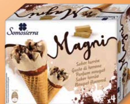
TURRÓN Torrão Nougat 4x120ml / 4x65g 410145