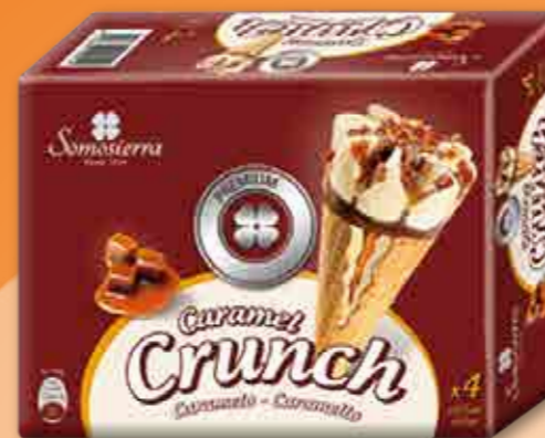
CARAMEL CRUNCH 4x120 ml / 4x65g 410109