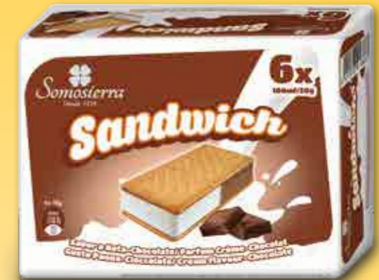
SANDWICH NATA-CHOCOLATE Cream Chocolate Crème Chocolat 6x100 ml / 6x50 g 450125