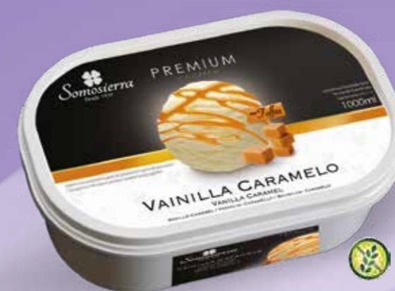
VAINILLA CARAMELO Baunilha Caramelo Vanille-Caramel Vanilla-Caramel 1000 ml / 470 g 200112