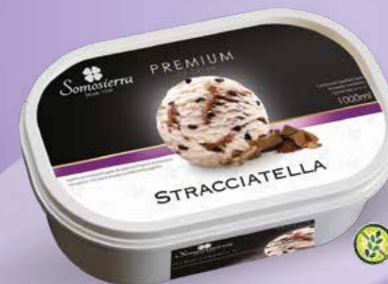
STRACCIATELLA 1000 ml / 470 g 200108