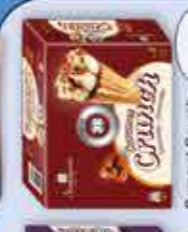
Caramel Crunch 100 ml x 4