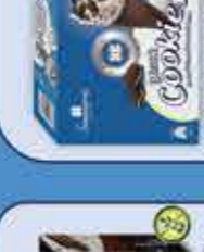
Black Cookies 120 ml x 4