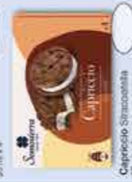
Capriccio Stracciatella 50 ml x 4