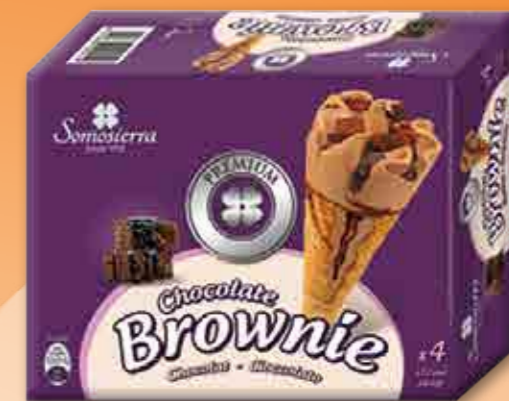
CHOCOLATE BROWNIE 4x120 ml / 4x65g 410128