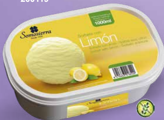
SORBETE CON LIMÓN Gelado de limão Glacé au citron Lemon fruit ice 1000 ml / 600 g 200120