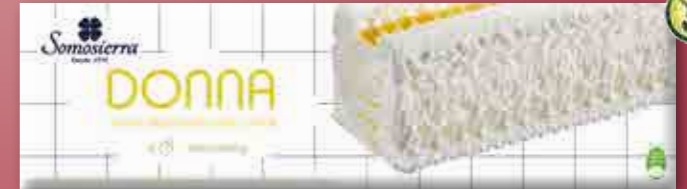
LIMÓN Límao / Lemon / Citron 1200 ml / 600 g 340120