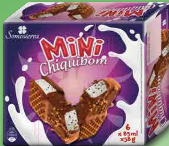
CHIQUIBOM STRACCIATELLA Nata Cream Crème 6x85 ml / 6x58 g 470108