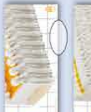
Whisky 1200 ml