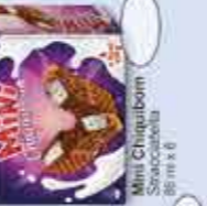
Mini Chocobon Stracciatella 80 ml x 6