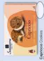
Capriccio Cookies 50 ml x 6