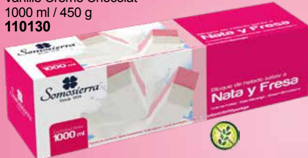
NATA FRESA Nata Morango Cream Strawberry Crème Fraise 1000 ml / 450 g 110122