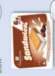
Sandwich Nata-Chocolate 100 ml x 6