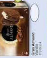
Gran Almond Vanilla 110 ml x 4