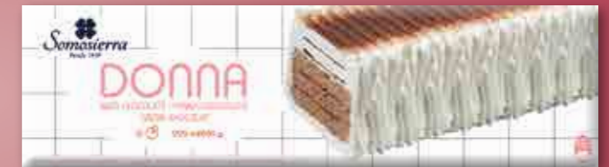
NATA-CHOCOLATE Cream Chocolate / Crème Chocolat 1200 ml / 600 g 340125