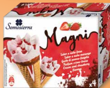
NATA-FRESA Nata-Morango Cream-Strawberry Crème-Fraise 4x120ml / 4x65g 410122