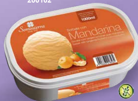
SORBETE CON MANDARINA Gelado de tangerina Glacé à la mandarine Tangerine fruit ice 1000 ml / 600 g 200115