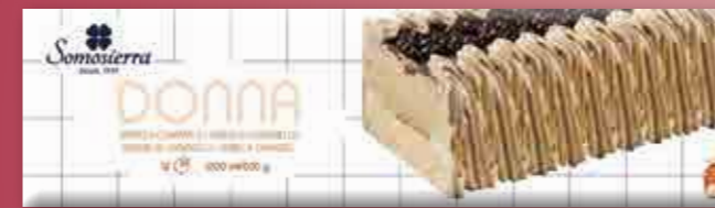
VAINILLA-CARAMELO Vanilla Caramel / Baunilha Caramelo / Vanille Caramel 1200 ml / 600 g 340112