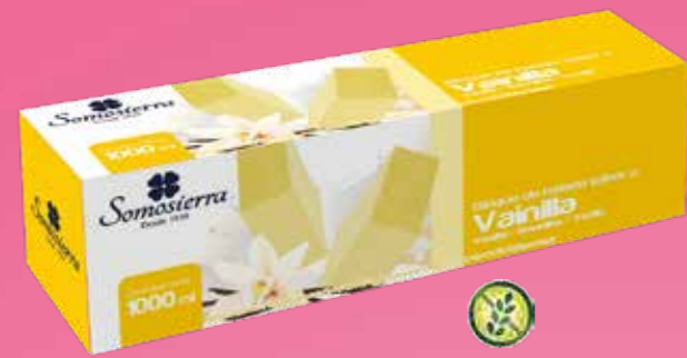
VAINILLA Baunilha / Vanille / Vanilla 1000 ml / 450 g 110101