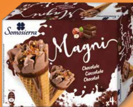
CHOCOLATE Chocolat 4x120 ml / 4x65g 410103