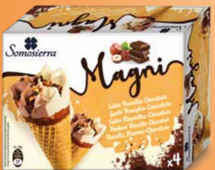
CHOCOLATE-VAINILLA Chocolate-Baunilha Chocolate-Vanilla Chocolat-Vanille 4x120 ml / 4x65g 410121