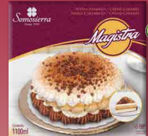
MAGISTRA NATA-CARAMELO Cream Caramel Crème Caramel 1100 ml / 575 g 360111