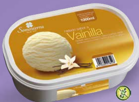
VAINILLA Baunilha Vanille Vanilla 1000 ml / 470 g 200101