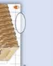
Vanilla-Caramelo 1200 ml