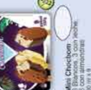
Mini Chocobon 3 Biscuits, 3 con leche 90 ml x 9