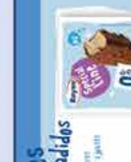
Nata-Chocolate 1200 ml