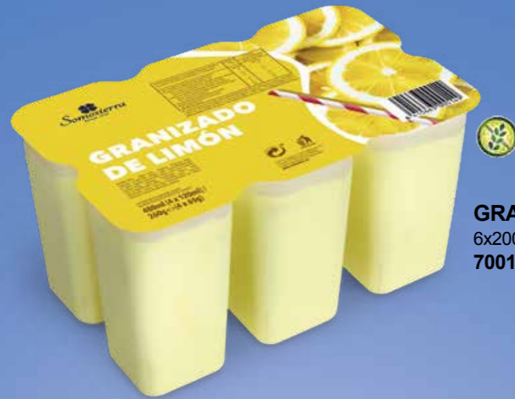
GRANIZADO LIMÓN 6x200 ml / 6x196 g 700120