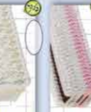
Limon 1200 ml