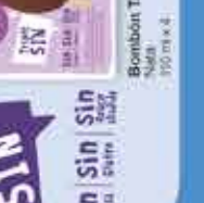
Sin Sin Limon | Cacao | Fresa