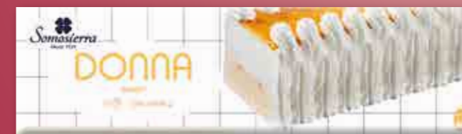
WHISKY 1200 ml / 600 g 340146