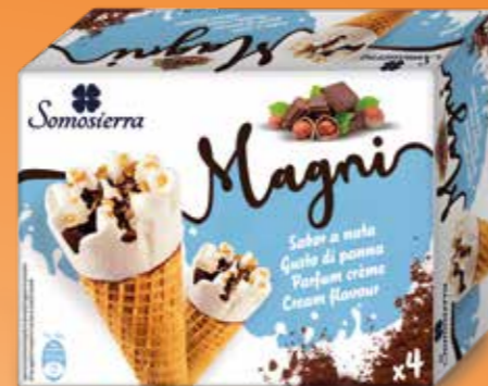
NATA Crème Cream 4x120 ml / 4x65g 410104