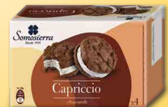
SANDWICH COOKIES CAPRICCIO Stracciatella 4x95 ml / 4x60 g 590108