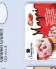
Magini Nata-Fresa 120 ml x 4