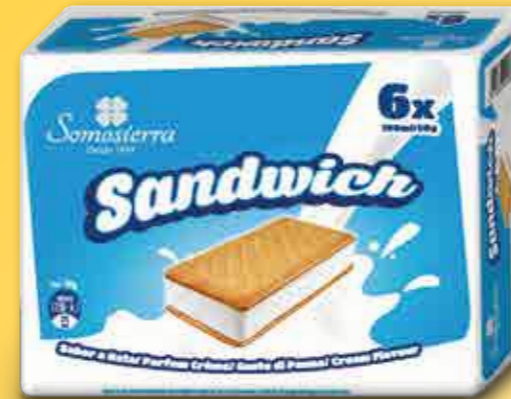
SANDWICH NATA Cream / Crème 6x100 ml / 6x50 g 450104