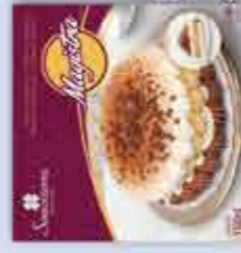
Magistra Nata-Caramelo 1100 ml