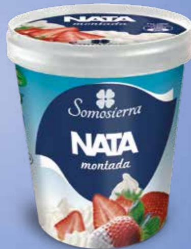
NATA MONTADA Ice Whipped Cream Crème Chantilly Glacée 500 ml / 240 g 610104