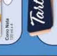
Ice Fruit 5 sabores-5 Limón 70 ml x 20