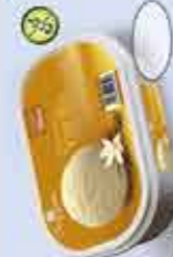
Vanilla 1000 ml