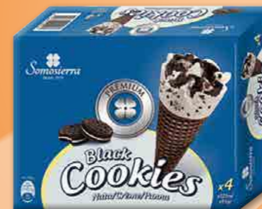
BLACK COOKIES 4x120 ml / 4x65g 410167